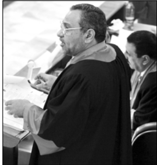
الدعي العام العراقي اثناء قراءة بعض المستندات المتعلقة بقضية الدجيل