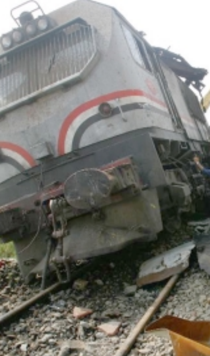
جانب من تصادم القطارين الحرق