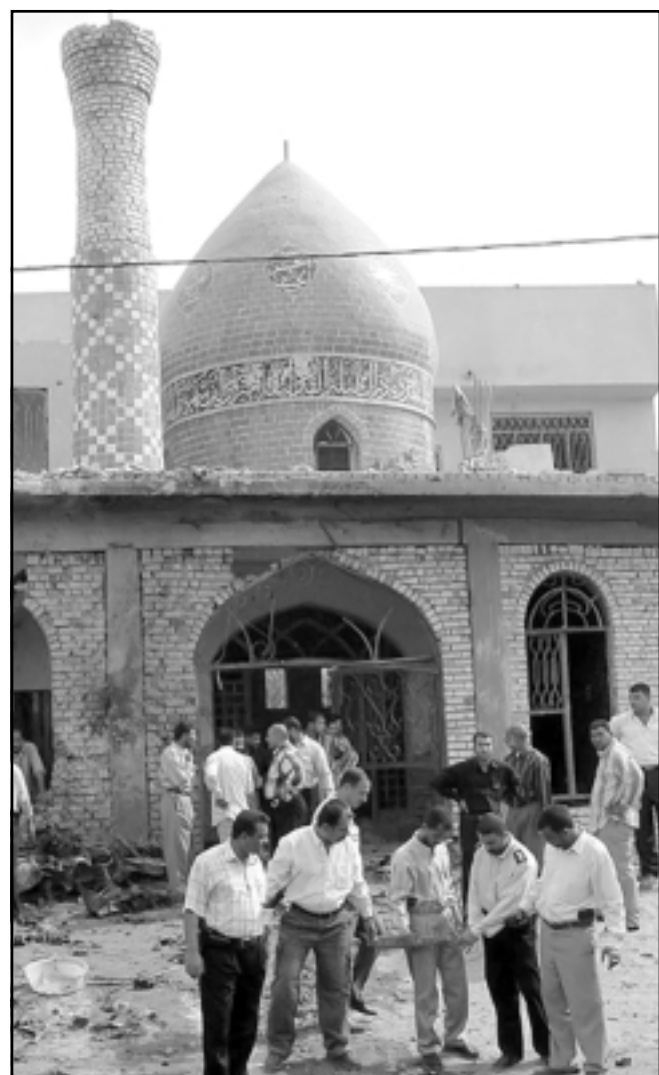
موقع الانفجار في مدينة كربلاء