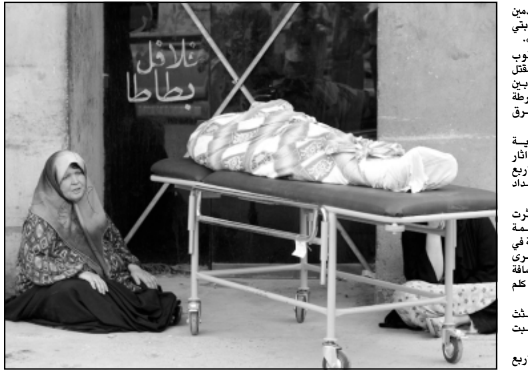
سيدة عراقية امام جثة قريب لها في مشرحة بغداد امس