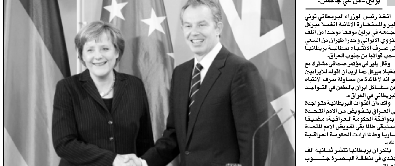
رئيس الوزراء البريطاني توني بلير و المستشارة الالمانية انغيلا ميركل اثناء المؤتمر الصحافي في برلين الجمعة

واضاف ان المساعي الدبلوماسية يجب ان تتواصل لحل الازمة على «قبول العاشر من الشهر الماضي استنفاها نشاطاتها لتخصيب اليورانيوم، كما دارت طهران على القرار الذي اتخذته الوكالة الدولية للطاقة الذرية في الرابع من شباط (فبراير) بقرار تعليق نظام الرقابة المغز