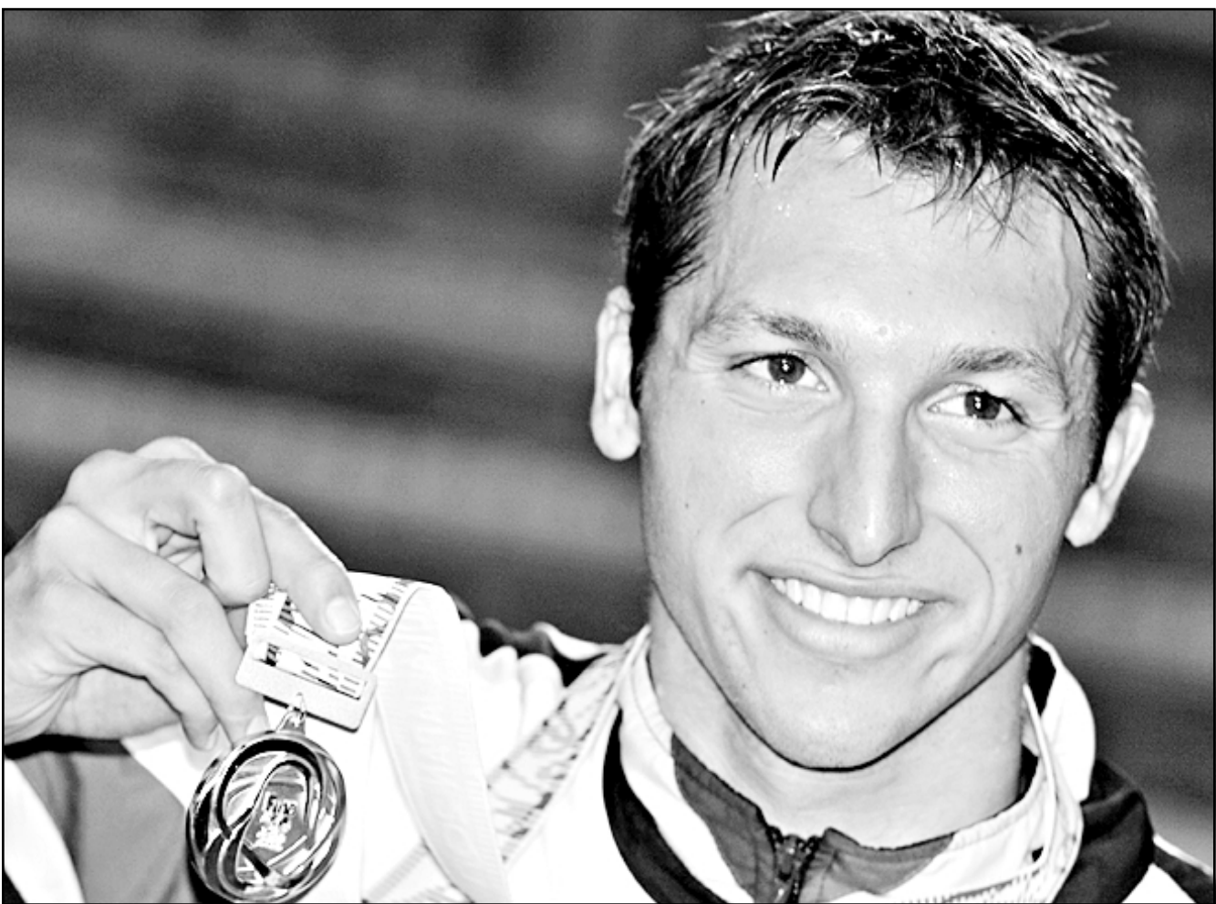
الاسترالي ايان ثورب

■ سيدني- أف ب: أعلن نجم السباحة العالمي والبطل الأولمبي الاسترالي ايان ثورب أمس الثلاثاء في سيدني اعتزاله. وقال ثورب (24 عاماً) في مؤتمر صحافي: «في تمام الساعة 2:53 من يوم الأحد الماضي قررت عدم خوض بطولة العالم للسباحة العام المقبل».