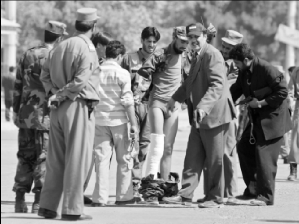
قوات من الامن الافغاني يفحصون مشتبها به في كابول

المحلية، وأضاف المصدر ذاته أنهم قدموا الى كويتا في 14 تموز من عام 2006. وكانوا من ضمن المجموعة الأولى التي دخلت أفغانستان في عام 2001. وكانوا يعملون في قوات المراقبة الجوية. وقال مصدر عسكري افغاني إنهم قتلوا 14 شخصا في جنوب غرب باكستان. وقال مصدر عسكري افغاني إنهم قتلوا 14 شخصا في جنوب غرب باكستان. وقال مصدر عسكري افغاني إنهم قتلوا 14 شخصا في جنوب غرب باكستان.