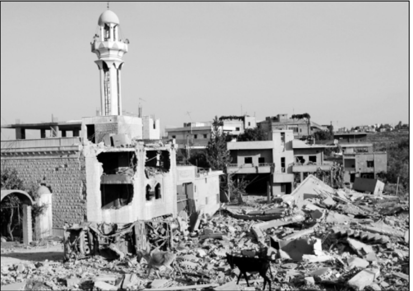
آثار الدمار الذي خلفته الغارة الاسرائيلية على قانا