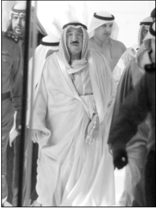
الشيخ صباح الاحمد الصباح لدى دخوله الى البرلمان امس

برس ان مجلس الوزراء سيعقد في وقت لاحق امس اجتماعا استثنائيا لبحث خلاله الشيخ صباح الاحمد الصباح اميرا جديدا للكويت. وكان الشيخ سعد الذي شغل منصب الكويت في 15 كانون الثاني (يناير) الحالي عقب وفاة سلفه الشيخ جابر الاحمد الصباح بعد ان حكمه الاخير هذه الامارة لغاية بانقطف على مدى 28 عاما، وتسلم الكويت 10 بائنة من الاحتياطي العالمي من النفط. وكانت صحة الشيخ سعد تدهورت بشكل كبير منذ خضوعه لعملية في القلوب في سنة 1997، حتى ان شكوكا حامت حول قدرته على اداء القسم القانوني امام البرلمان لتولي مهامه اميرا على الكويت. أكد مجلس الوزراء الكويتي في رسالة وجهها الى البرلمان لطلب عقد جلسة تنحية الامير كانت بنيتها وكالة الانباء الكويتية الاثنين انه «ثبت لدى مجلس الوزراء ان حضرة صاحب السمو امير البلاد فقد قدرته الصحية على ممارسة صلاحياته الدستورية». وجاء التصويت على تنحية الشيخ سعد امس في جلسة خاصة للبرلمان بطلب من الحكومة التي حاولت حتى اخر لحظة اقتناع الشيخ سعد بالتنازل عن الحكم لتفادي تنحيته. وتم تجلس الجلسة امس مرتين وذلك لئلا الامير وانصاره مهلة اضافية للتخلي عن الحكم طواعية. وكان من المفترض ان يعلن الشيخ سعد