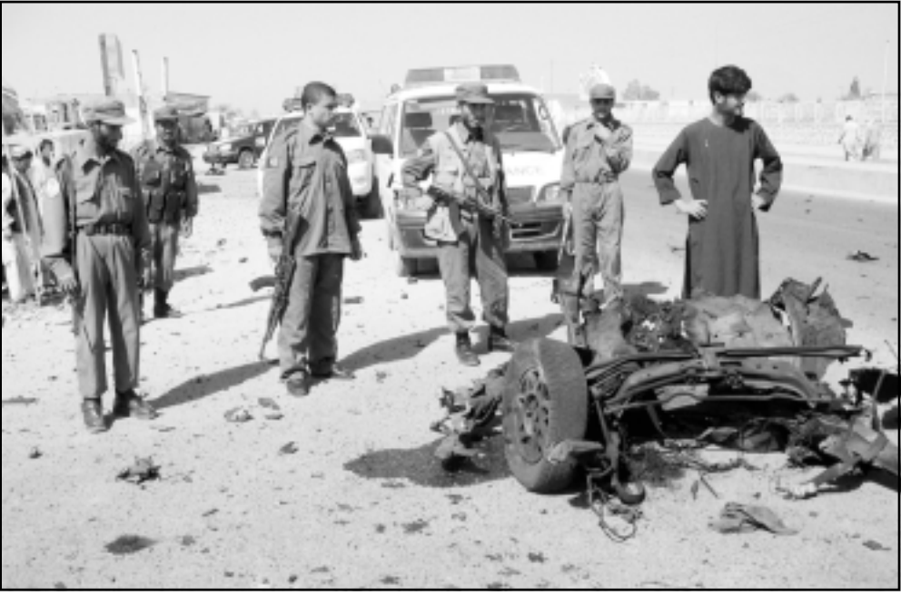
جنود افغان يتفقدون موقع العملية الانتحارية في قندهار

■ كابول- قندهار- أوتارا- تيرانا- اف ب- رويسنرز- اعلنت وزارة الدفاع والشرطة الافغانيتان امس الاربعاء مقتل 14 عنصرا من حركة طالبان واعتقال 18 آخرين في شرق افغانستان.