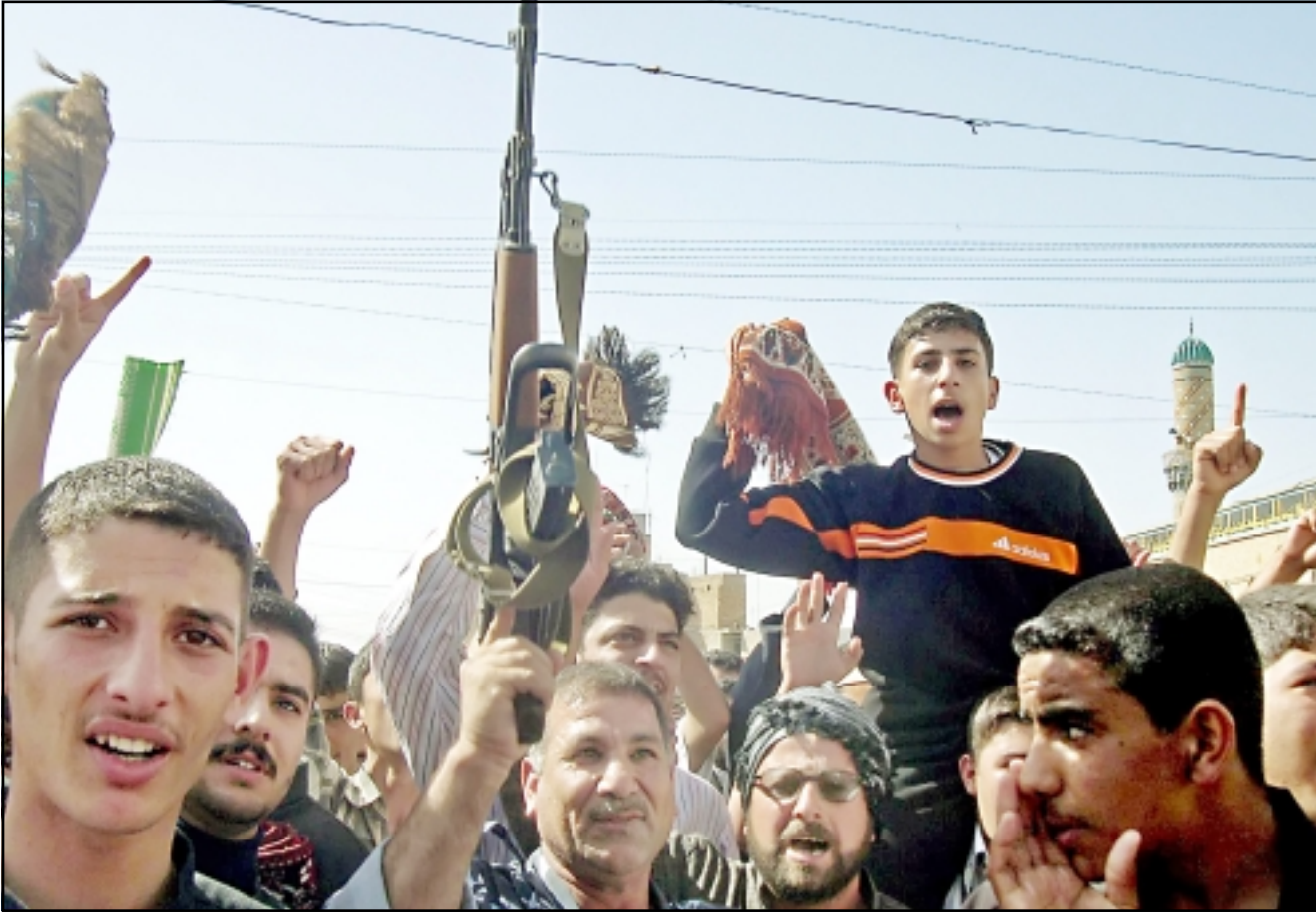
عراقيون يتظاهرون مرددين شعارات معادية ليران في مدينة سامراء الجمعة

وسط اجواء غير مسبوقة من التوتر الطائفي، وحظر تجوال للسيارات، وحراسات أمنية مشددة على المساجد والمنشآت الحيوية، وتوقعات أمريكية بـ«ضربة كبرى» من تنظيم «القاعدة» في العراق، كان البغداديون يحيسون انفسهم بينما كانوا يتجهون لاداء صلاة الجمعة. وبالرغم من اجماع الاثمة على الدعوة للوحدة الوطنية، إلا ان احداثا طائفية جديدة عكرت الاجواء، إذ قام مسلحون في النهروان بقتل 19 عاملا شعبيا بهجوم شوهه على محطة كهرباء خالية ومصنع لانتاج الطوب. كما قتل خمسة عراقيين بهجمات اخرى. وقال مصدر في وزارة الداخلية انه تم العثور على جثث العمال صباح الجمعة. وأضاف المصدر ان بعض الجثث لا تزال ملقاة بالقرب من المصنعين، لكن قوات الامن العراقية فضلت انتظار تعزيزات من الوحدات الجنسية لتواصل البحث، وأشار المصدر ذاته الى ان المسلحين قاسوا «بنفس محطة الكهرباء» على مصنع الطوب حيث احرقوا قاعة الطعام وقتلوا عددا من العمال والقوا بجثثهم في المنطقة القريبة. وتقول الشرطة ان النهروان منطقة خطيرة جدا وان عددا قليلا من عناصر قوات الامن منتشرون فيها. وآثر حادثة مقتل العمال، انتاب الخوف العديد من العائلات التي بدأت تستعد للهجرة عند اقارب مقربين في مناطق أكثر امانا. وقال قائد القوات الامريكية في العراق الجنرال أرمي ليفت عن ذلك على ان سبب تفجير مزارع شيوعي الاسبوع الماضي قد مر لكنه رفض استبعاد احتمال نشوب حرب اهلية. وقال الجنرال جورج كيسي للصحافيين في وزارة الدفاع الامريكية (البيتاغون) انه لم يتخذ قرارا بعد بشأن ما اذا كان سيقدم توصية لوزارة الدفاع والرييس