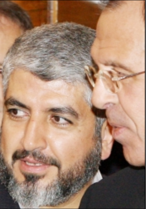
موسكو - من كريم طالب: