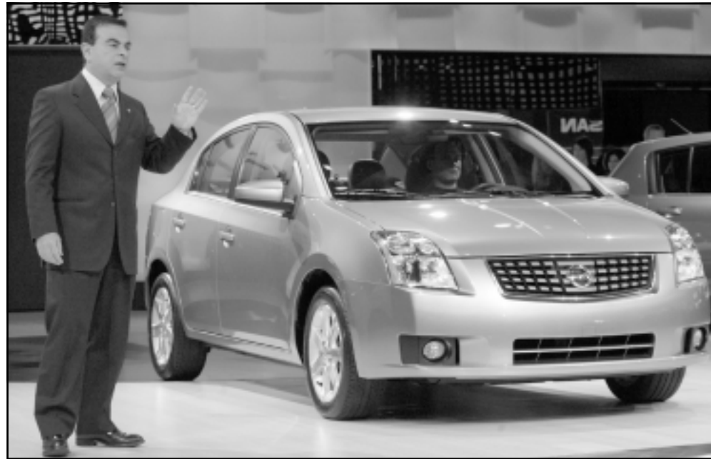
رئيس شركة نيسان يعرض السيارة الجديدة في معرض ديترويت

■ بال (سويسرا) - رويترز: قال محافظو مصارف مركزية من دول رئيسية امس الاثنين ان الاقتصاد العالمي يتسبب بانشاط وان النمو قد يتجاوز العمل القوي الذي حققه في 2005 في ظل مؤشرات على انتعاش استثمارات الشركات. وقال رئيس البنك المركزي الأوروبي جان كلود تريشيه في مؤتمر صحفي ان صعود أسعار النفط الخام فشل في كبح الاقتصاد واد من مصداقية البنك المركزي في السيطرة على ارتفاعات أسعار النفط. وقال تريشيه بعد اجتماع محافظي المصارف المركزية لجمعة العشرة للدول