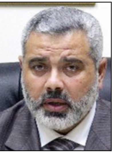
لندن - «القدس العربي»:

علمت «القدس العربي» ان السيد اسماعيل هنية رئيس وزراء حكومة السلطة الفلسطينية تقدم بطلب لزيارة الاردن اثناء جولته الحالية التي تعتبر الاولى من نوعها في المنطقة وتشمل مصر والسعودية وسورية والكويت وقطر وايران، ولكن السلطات الاردنية لم توافق على هذا الطلب. وقالت مصادر فلسطينية ان السيد هنية بعث برسالة الى السفير الفلسطيني في العاصمة الاردنية يكلفه فيها بترتيب زيارته للاردن قبل اربعة اسابيع، ولكن يبدو ان جهود السفير في هذا الخصوص لم تكل بالنجاح.