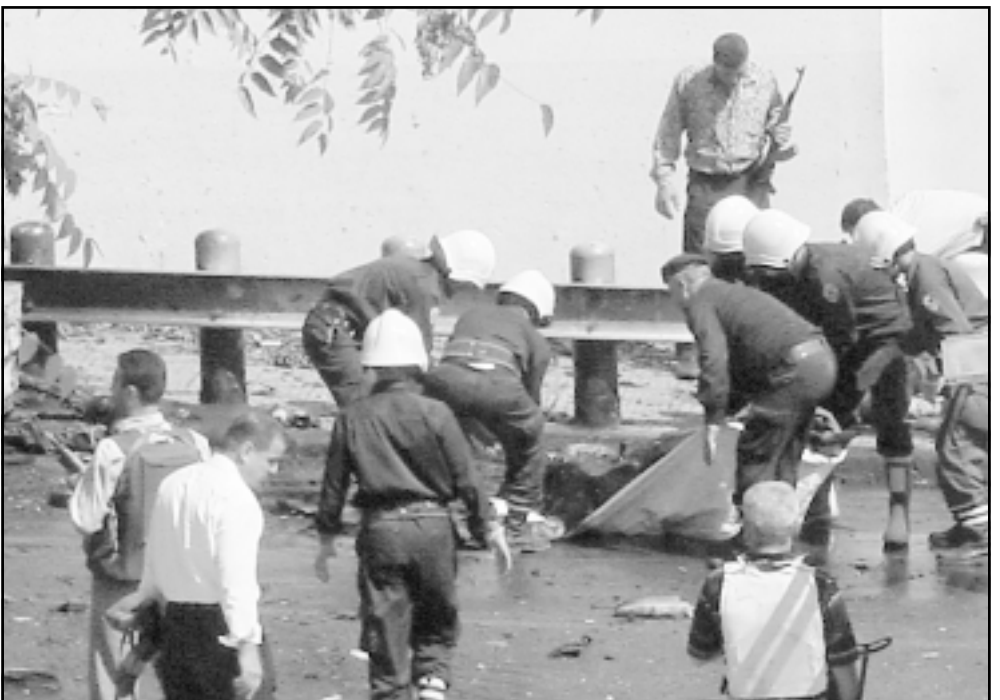
رجال امن سوريون يتفقدون جثث المسلحين من امام السفارة الامريكىة الثلاثاء