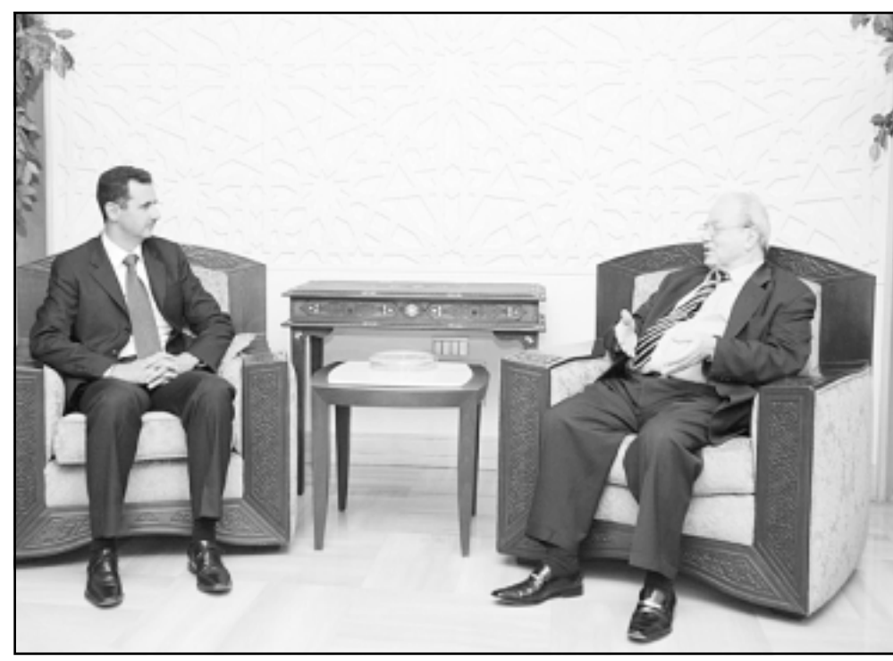
الرئيس السوري حافظ الأسد مستقبلاً فاروق القدومي امس

قضية الشعب الفلسطيني الشقيق ويضمن حق عودته الى ارضه وعدم توطينه في لبنان وتطبيق القرارات الدولية ذات الصلة بالنزاع العربي- الاسرائيلي. وجد الرئيس لحود ايدانته للممارسات الاسرائيلية العدوانية بحق الشعب الفلسطيني، مؤكداً ان لا سلام عادلاً ودائماً وشاملاً في منطقة الشرق الاوسط ما لم يضمن حق الشعب الفلسطيني في العودة الى ارضه. وتمنى الرئيس لحود للسيد زكي التوفيق في مهمته الجديدة كعضو للجنة التنفيذية لمنظمة التحرير الفلسطينية. وكان ممثل منظمة التحرير زار وزير الخارجية اللبناني فوزي صلوح الذي تسلم منه نسخة من كتاب اعتماده في لبنان، بمشاركة مدير المراسم السفير مصطفى ومصطفى، وخالد عارف عن الجانب الفلسطيني. وتحدث زكي فقال «الحمد لله المياه تعود الى مجاريها ونستأنف التمهيل الرسمي بين فلسطين ولبنان، ووجدنا كل ترحيب وتفاهم ونقوم بالاجراءات كافة التي تسهل للعلاقات في المستقبل بين اقرب اثنين، وأكثر اثنين (مشغول) بهم العالم ولبنان وفلسطين». سئل: هل تشكل الوفد الفلسطيني للتفاوض مع الجانب اللبناني من جميع الفصائل ام أنك ستعمل على تشكيله؟ اجاب: «ان الافكار ناضجة ولا خلاف على ذلك، وتشكيل وفدا مرهون ببناء الحوار اللبناني- اللبناني، لكن لدينا الجاهزية، والاوراق كافة معدة لمناقشة او الاستعمال الموضوع المتعلقة بالحوار الفلسطيني- اللبناني». وهل يعني ذلك ان لا حوار فلسطينيا- لبنانيا وابطائها هو الحصر اللبناني- اللبناني؟ اجاب: «كلا، الفرق على همامته، لكن كنا نتمنى ان يصل الحوار اللبناني- اللبناني الى نتيجة كي لا نأخذ من وقتهم وجهدهم، انما الاخوة جميعهم حريصون على ان يكون اي حوارات لبنانية على حساب حقوق الفلسطينيين».