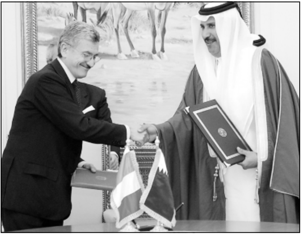
وزير الخارجية القطري ونظيره ايطالي خلال اجتماعهما في الدوحة

وقالت الحكومة الامريكينة ان الهجوم أسفر عن مقتل ما يصل الى عشرة من حلفاء القاعدة ولكنه لم يصب الهدف الرئيسي وهو ثلاثة من كبار المشتبه بهم. وتنفى واشطن شن اي ضربات أخرى. وقال ديناري «لعلنا من الامريكين مسح الجو والبحر»، مضيفا أنه لا توجد قوات أمريكية على اراضي الصومال. ومضى يقول «من حق الحكومة الامريكينة البحث عن الراهبين الذين فروا للسفارتين». وتكر ديناري انه تم التصدي لعدد من «الراهبين» يحملون جوازات سفر دنمركية وايرتية وسويدية.