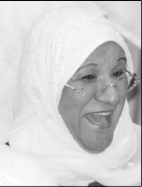
معصومة المبارك وزيرة الاتصالات