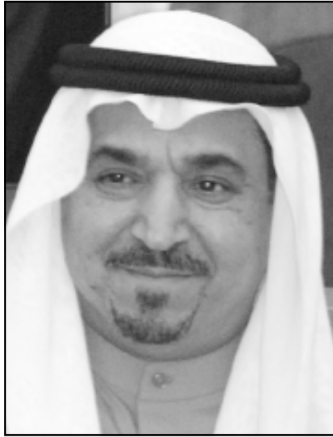
الشيخ علي جراح الصباح وزير الطاقة الجديد

بعد الانتخابات في 12 تموز (يوليو)، وضمت الحكومة، وهي الثالثة المعشرون منذ استقلال الكويت عام 1961، ثلاثة وزراء جدد.