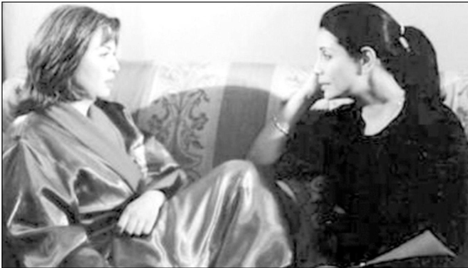
سوسن بدر في أحد أدوارها السينمائية مع الهام شاهين