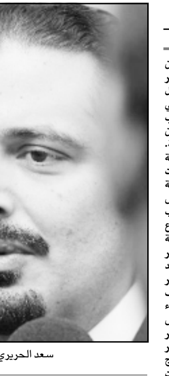
بيروت - القدس العربي

يستمري باصدار البيانات، ولكن هذه هي الرابطة الثارونية ونحن نعرفها جيداً الداخلي، فيها بعنا كامييرات المراقبية في بيروت الكبرى». وفيما وصل الى كول غاسيان، وزير خارجية السودان لأم اقول اجابون، أتيا من الخرطوم من طريق عمان في زيارة رسمية تستغرق ثلاثة ايام يقابل خلالها كبار المسؤولين لاستكمال البحث في العلاقات اللبنانية السورية، وبع الوزير السابق فرنجية دائرة استهدافاته السياسية، فيبعد استهدافه احد مطاردة ايام الدبيات السورية لمعهما من مغامرة لبنان، فاعتقدنا انه مات بفساد، لكنه ما زال بصحته والحمد لله، ولا ادري ان كان تبدل او تغير كمال الاخرين»، اما بالنسبة لسفير جعبع الذي قال بفضل 200 مرة ان تكون مرجعيتنا قريطم على ان تكون دمشق فقال فرنجية «شكره على اعترافه بان مرجعيته قريطم، ولكننا نود ان نقول له انه ليس عندما دين يجب