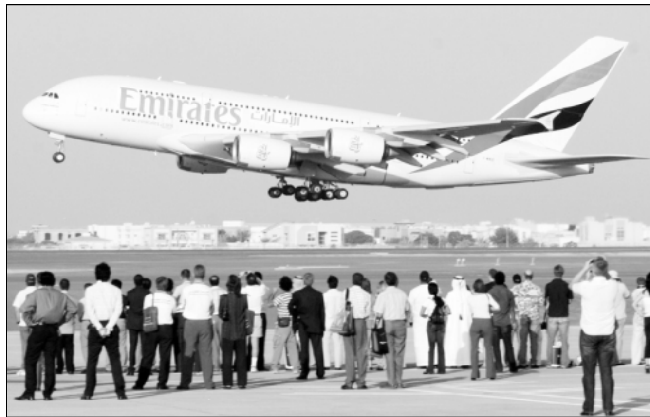
نموذج تجريبي لطائرة ايه 380 صنع لحساب طيران الامارات

الام (اي.اي.دي.اس) امس الاربعاء لفترة تتراوح بين ستة اشهر و عام واحد سيسبب مشاكل جدية للشركة التي تملكها حكومة دبي لانه سيكون من شأنه تأخير خطتها للتوسع.