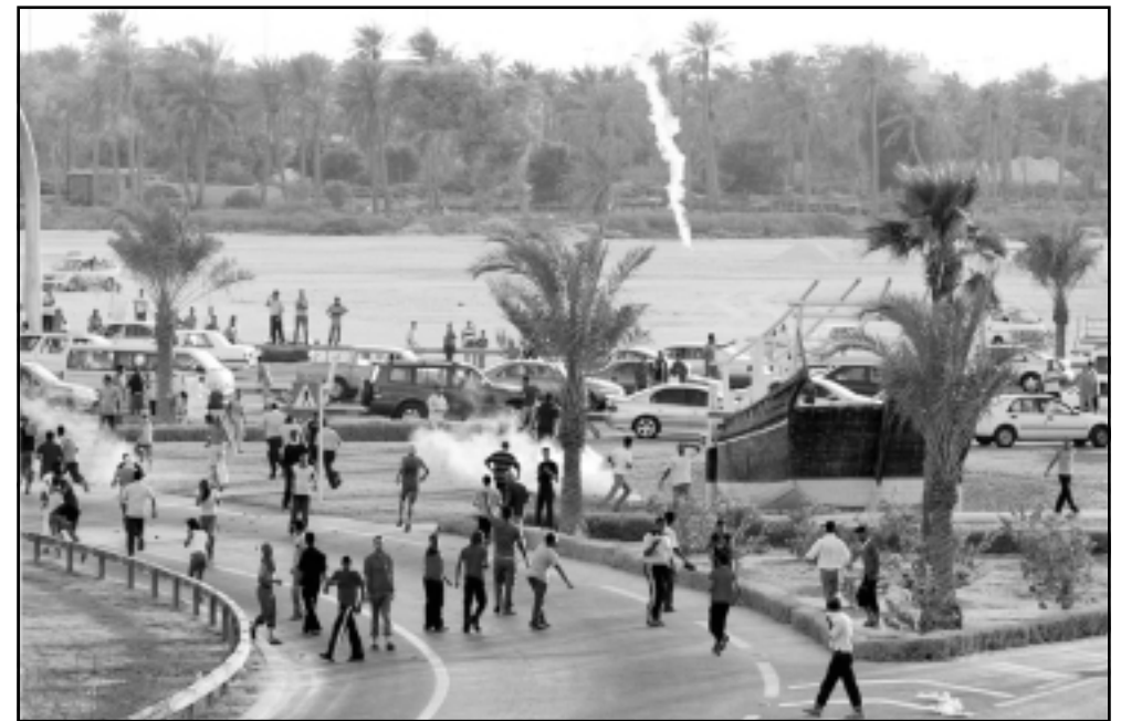
مظاهرون في البحرين ضد مشروع الانتخابات الالكترونية