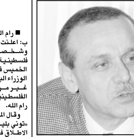
ياسر عبد ربه

العربية والاتفاقيات الموقعة سابقا. وحول الحكومة المنتظر تشكيلها، قال عبد ربه: يجب ان يتاح المجال لجميع الكتل للمشاركة في الحكومة المنتظر تشكيلها وفق المشروع الذي أعدته اللجنة التنفيذية والذي حمل اسم خطة الرئيس.