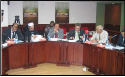
الإرهاب وأسلحة الدمار الشامل