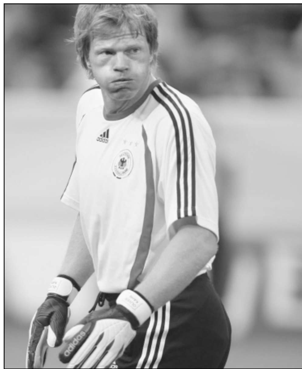
حارس الرمي الالماني اوليفر كان

وأوضح هدف الدوري الالماني موسم 2005-2006 برصيد 25 هدفا «هناك 3 او 4 اندية من اعلى مستوى اوروبي سأنظر في عروضها. اما بالنسبة الى الاندية