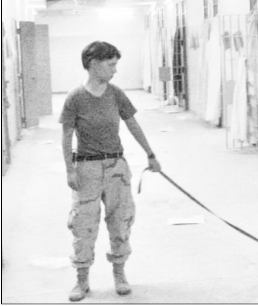
صورة من غلاف الكتاب «حياة القسم» في اطار مشهد التعذيب الأكثر شهرة في معتقل ابو غريب

كانت التعليمات الاولى التي اصدرها وزير الدفاع الأمريكي دونالد رامسفيلد للمحققين الامريكيين في السجون السرية ومعتقل غوانتانامو، خارج اطار مينشاق جنيف لعاملة اسرى الحرب. وتقول التعليمات انه يجب على اطباء المشاركة في مراقبة عمليات تعذيب المعتقلين. ويقوم كتاب صدر حديثاً في امريكا على قراءة وتحليل 35 الف وثيقة استفاد منها مؤلف الكتاب بناء على قانون حرية المعلومات. ويحمل الكتاب عنوان «حياة القسم»، اي قسم ابو قراط الطبي، والذي اعده الطبيب المتخصص في مجال اخلاقيات الطب، الدكتور ستيفن مايلز. وهو توثيق مرعب عن الطريقة التي قام بها الثنائي بوش-رامسفيلد بافساد اخلاقيات المهنة الطبية. ومن القواعد التي قدمها رامسفيلد للمحققين تقوم على تقديم الملف الطبي للسجين الذي يجب ان يكون بينه وبين طبيب السجن للمحققين، وذلك لمساعدتهم للتعرف على مناطق الضعف والقوة النفسية للسجين واستخدامها كسلاح لاستخراج المعلومات وفي عمليات التعذيب. وفي معسكر تحقيق يدعى معسكر «نعاما» كان الشعار غير الرسمي «لا دم، لا اثار»، حيث قال مسؤول تحقيق ان كل عملية تعذيب او تحقيق قاس تمت ادارته بمصادقة من قائد المعسكر والمسؤول الطبي. وتقول مجلة «التايم» في تقرير لها ان الابطاء العاملين في المعسكر وقعوا على ورقة التعذيب مقدما، ولم يقوموا بمعالجة قصص المعتقل بعد تعذيبه.