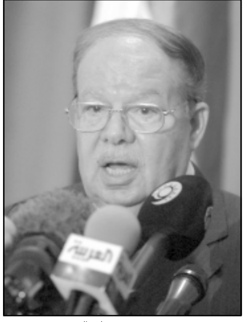
فتحي سرور رئيس مجلس الشعب

عبر العشرات من رموز المعارضة المصرية عن ادانتهم لتصريحات د. فتحي سرور رئيس مجلس الشعب المصري والتي اتهم فيها قوى وجماعات المعارضة بأنهم افسدوا القضاء وقاموا بتسييس خلافهم مع الحكومة المصرية.