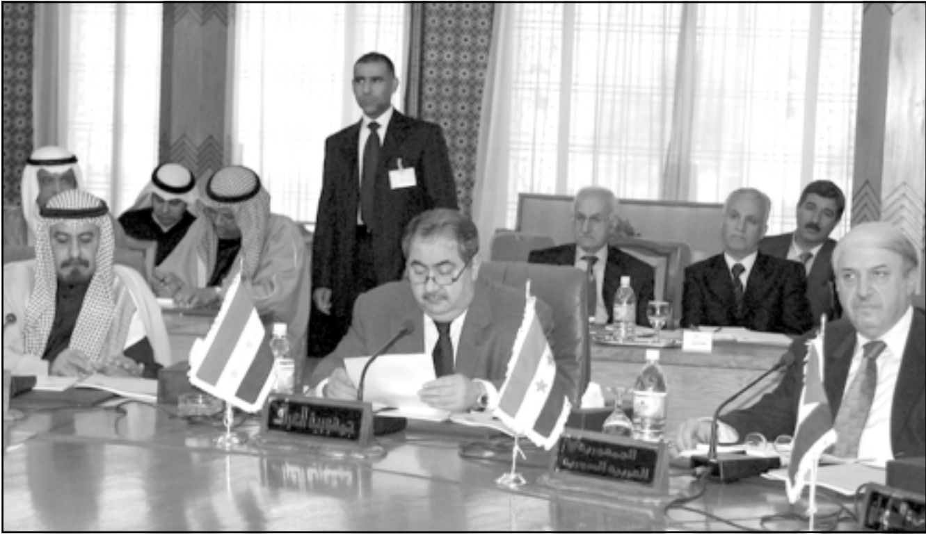
وزير الخارجية العراقي هوشيار زبياري اثناء حضوره الاجتماع الوزاري في القاهرة امس

الاجتماع الوزاري العربي حول العراق يعلن قلقه من انتشار الفوضى والعنف الطائفي في المنطقة