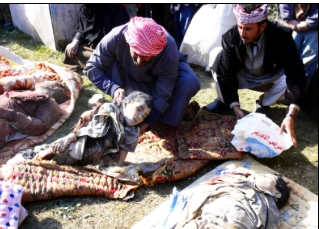
جثامين لاطفال من بين ضحايا المجزرة الامريكية الجديدة في بلدة الاسحاقي شمال بغداد الجمعة