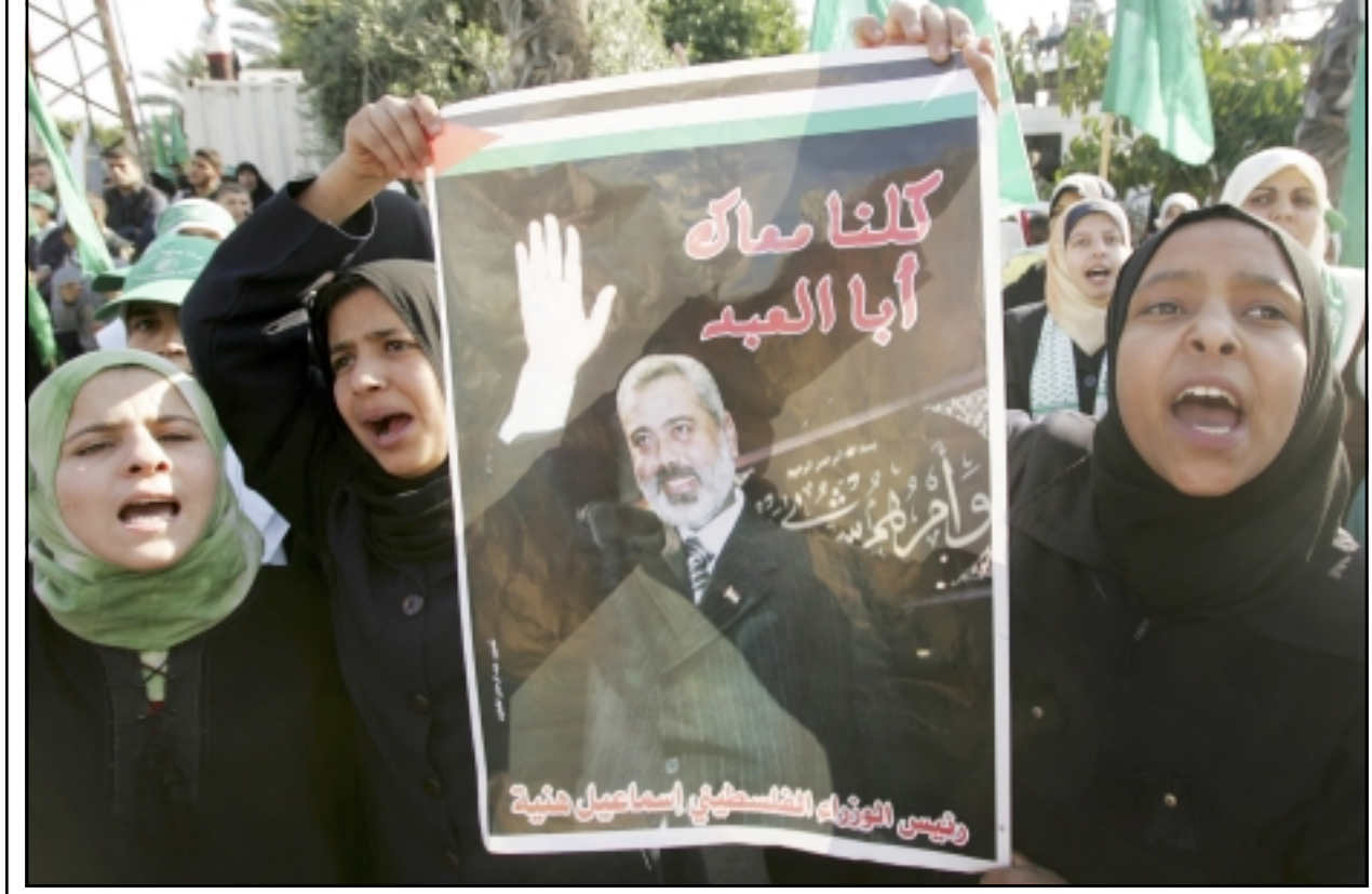
فلسطينيات يحملن صورة اسماعيل هنية أثناء مشاركتهن بمظاهرة نظمها حركة حماس في غزة الجمعة