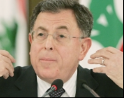
رئيس الوزراء اللبناني فؤاد السنيرة