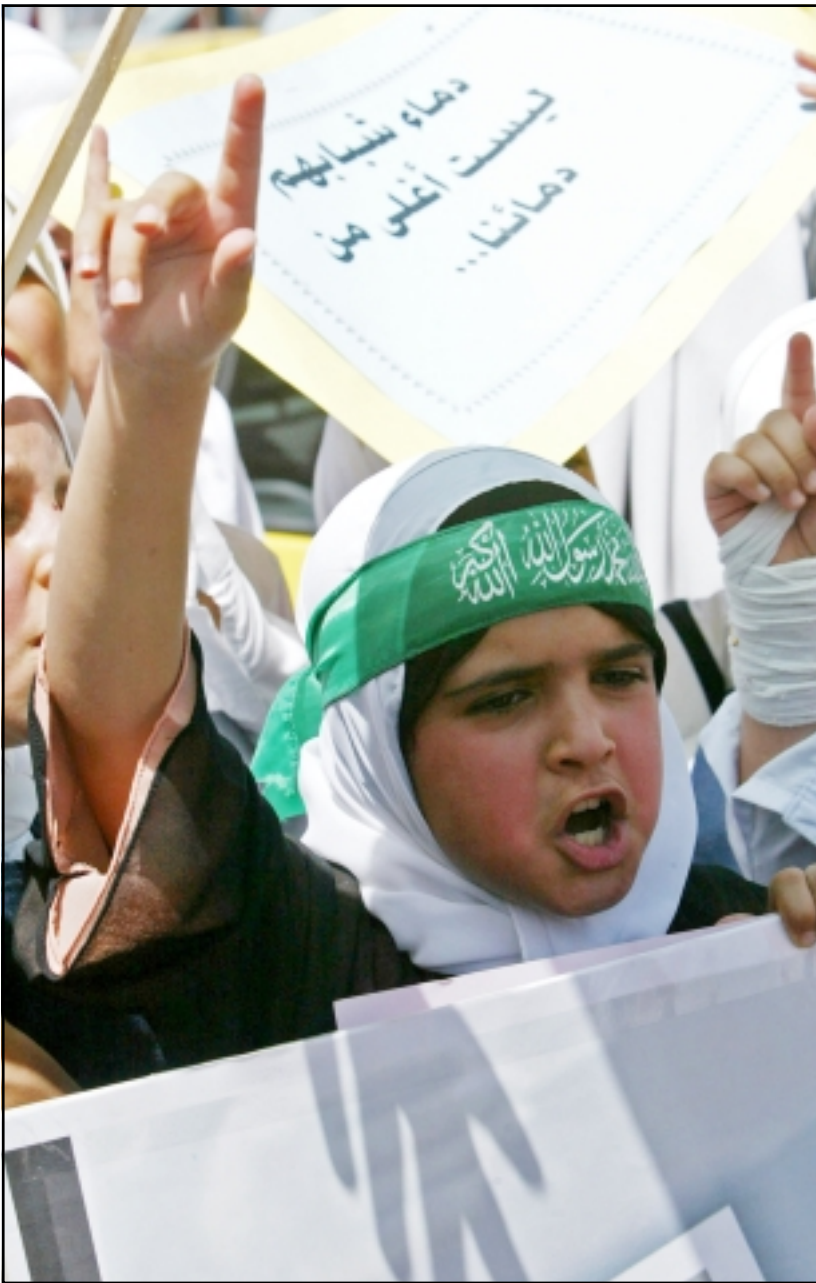
طفلة فلسطينية تشارك في تظاهرة ضد الاحتلال الإسرائيلي في مدينة نابلس

بحث اسماعيل هنية رئيس الوزراء الفلسطيني خلال اجتماعه مع وفد اممي مصري رفيع المستوى في مقر اقامته بمدينة غزة يوم السبت الماضي عدد من القضايا الهامة التي تتعلق بالوضع الفلسطيني والمستجدات على الساحة الفلسطينية. وفي تصريح صدر عن مكتب رئيس الوزراء أوضح أن هنية يرافقه سعيد صيام و وفد اممي مصري الفلسطيني التقيا بوفد اممي مصري برئاسة اللواء رافت شحادة وبحضور المستشار أحمد عبد الخالق من السفارة المصرية بمدينة غزة. وأشار التصريح إلى أن اللقاء تناول البحث في مختلف القضايا الهامة التي تتعلق بالوضع الفلسطيني والمستجدات على الساحة الفلسطينية وبحث قضية معبر رفح والمشاكل التي يواجهها الفلسطينيون في الدخول والخروج من المعبر في ظل استمرار الجانب الإسرائيلي في التحكم بفتح وإغلاق المعبر وحل مشاكله مع المراقبين الأوروبيين والجانب الإسرائيلي. وكشفت بعض المصادر أن اللقاء تناول أيضا الوضع الداخلي الفلسطيني ومبادرة رئيس الوزراء اسماعيل هنية التي طرح فيها وفقا لاطلاق