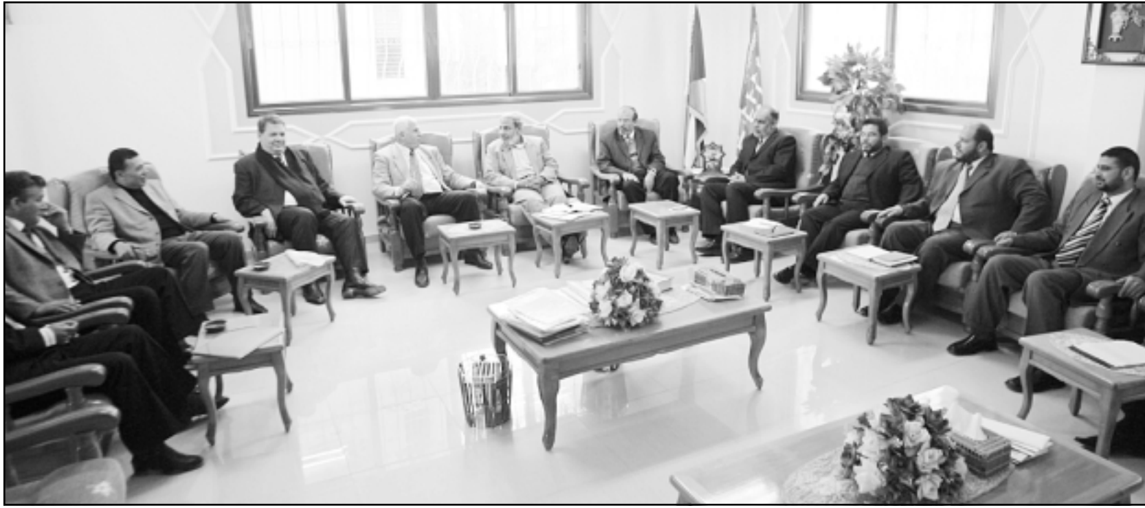
أعضاء من حزكي حماس وفتح في اجتماع بحث تشكيل الحكومة المقبلة في غزة امس