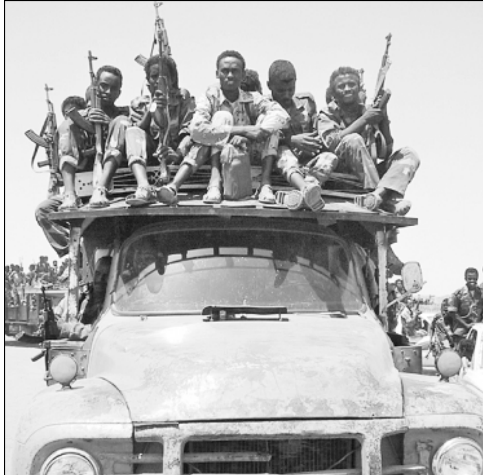
قوات متمرد في شرق السودان في مدينة كسلا

وأكد متحدث باسم وكالة المخابرات الخارجية الالمانية (بي. ان. دي) وجود عميلين للمخابرات الالمانية في العراق قبل واثناء الغزو الذي قاده الولايات المتحدة للعراق. لكنه قال ان التقرير الذي نشر في صحيفة سودويتشه تسايتونج «زيف ومشوه». وقال المتحدث