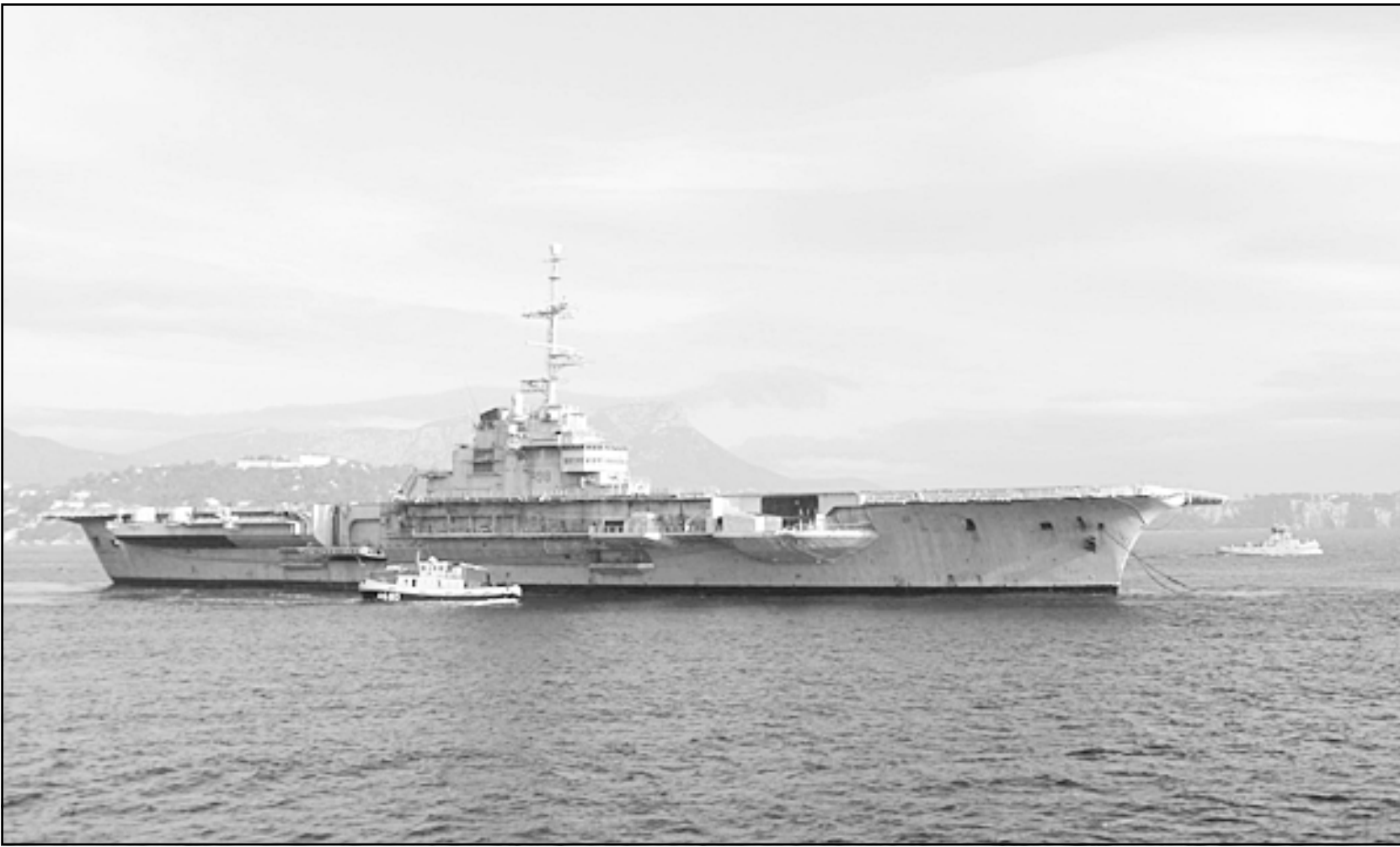
حاملة الطائرات الفرنسية كليمنصو لدى مغادرتها ميناء طولون جنوب فرنسا الاسبوع الماضي