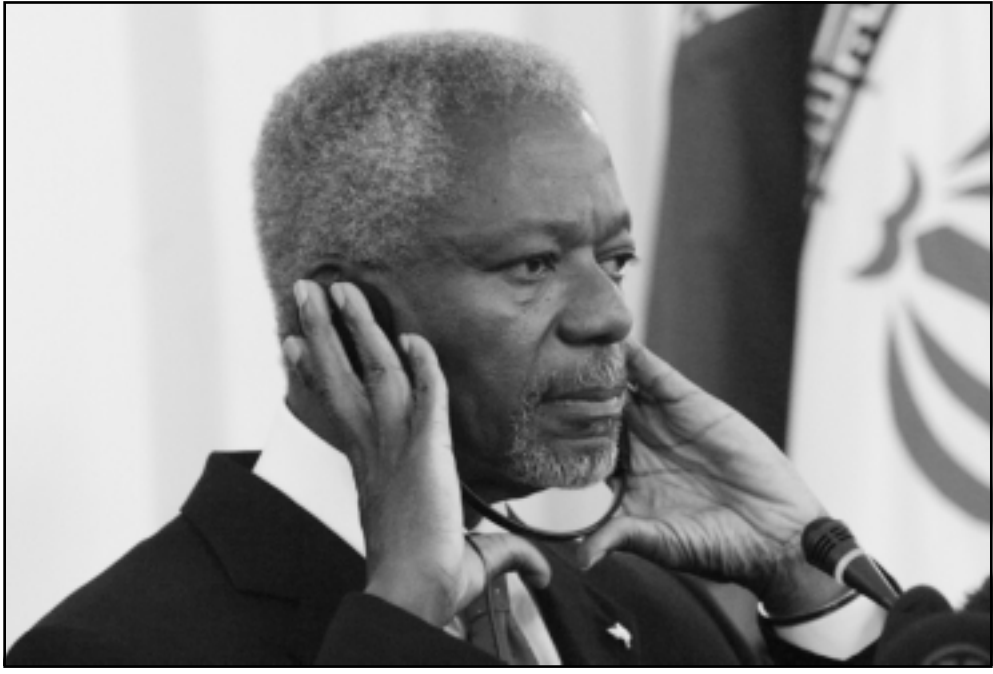
عنان يتحدث في مؤتمر صحفي ب طهران امس

مجلس الامن فرض عقوبات او تدابير عقابية، فلا شك ان الجمهورية الاسلامية الايرانية ستراجع سياسة التعاون التي تبنتها، مع الوكالة.