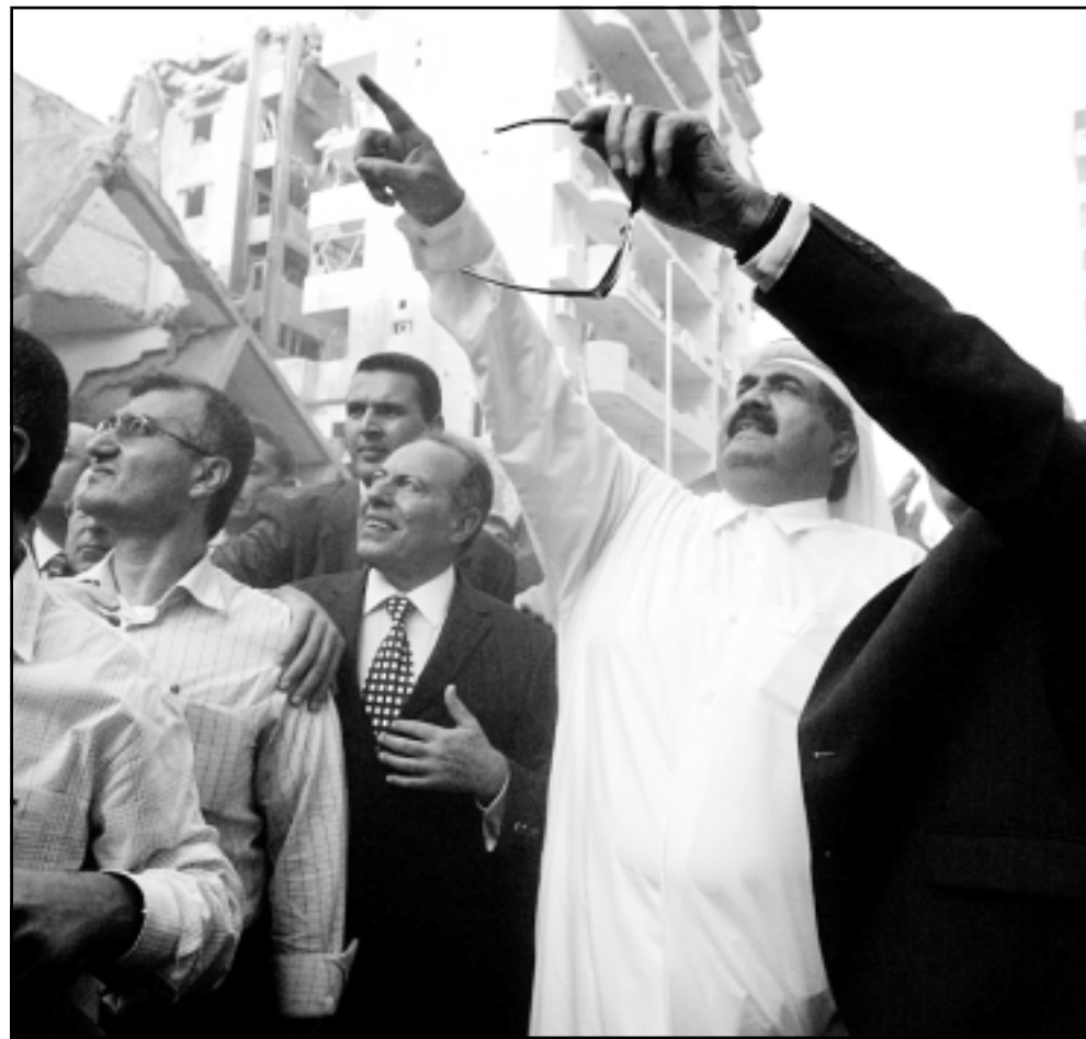
أمير قطر والرئيس اميل لحود يتفقدان آثار الدمار في بيروت