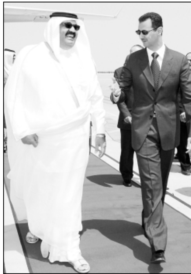
الرئيس السوري لدى استقباله أمير قطر