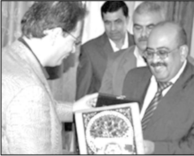
محافظ عمان عمر المعاني يتسلم جائزة

بالرحيل أو دفع المستحقات، وفي ذلك تغيير جذري وكبير في الواقع لم يألفه أهل عمان في الماضي. العمدة الجديد يتحدث أيضا عن عمان جديدة ستضاف لعمان القديمة ويرفض الاعتراف بما يعتبره «أخطاء إدارية وتنظيمية» حصلت في الماضي ويعتبر نفسه غير مسؤول عن اصلاحها، ولا يبدو مهتما بالاستماع الى ايقاع الشارع ولا بحضور نشاطات ولا يفتتح معارض وسلكتها امام العمدة الجديد الذي لا يعرف الناس ولا يعرف مقربون منه تعليقا على حدث حصل لأول مرة منذ عشرات السنين، فالبلدية مؤخرا «اقترضت» كغيرها من المؤسسات بعد ان كانت جهة ترفض وتمول وبعدها ان كانت طوال عقود «أغنى» المؤسسات وأكثرها دخلا بسبب الضرائب والرسوم التي يدفعها أهالي عمان. النثير ان العمدة المعاني محسوب على الصف الإصلاحى وغير شخصيته المركبة يفترض أن يطال الإصلاح الذي لا تعريف له الآن في الأردن أعرق مؤسسات العاصمة وأكثرها رمزية في الدولول السياسي. بالنسبة للكثيرين العمدة الجديد ليس رجلا اشكاليا فهو من خارج النادي التقليدي ولا يمثل أي نقل عشارتي من انتقال العاصمة لكنه لا يمثل في الوقت نفسه ايقاع الشارع العماني خصوصا وان عمان أصبحت مدينة مختلطة كغيرها من العواصم المتحضرة في العالم. والشغب على الرجل بكل الأحوال