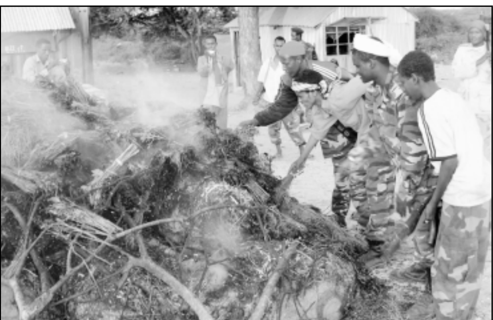
اسلاميون صوماليون يحرقون «القات» المستورد من اثيوبيا

الى ذلك وجهت الولايات المتحدة الاربعة انتقادات الى اريتريا بسبب المساعدة التي تقدمها الى الميليشيات الاسلامية في الصومال. وقال غونزالو غاليغوس احد المتحدثين باسم وزارة الخارجية الأمريكية، ان الولايات المتحدة «تשמع بالقلق منذ فترة طويلة جراء اعمال زعزعة الاستقرار في الصومال التي تقوم بها بلدان مثل اريتريا التي تدعم التوسع العسكري المستمر للحاكم الاسلامي في الصومال». وأضاف ان «الولايات المتحدة تدعو كافة البلدان المجاورة للصومال الى الامتناع عن القيام باعمال يمكن ان تؤدي الى مزيد من زعزعة استقرار الوضع». إلا ان واشنطن رفضت ادانة مصر والسعودية اللتين تساعدان ايضا، كما جاء في تقرير الامم المتحدة، الاسلاميين الصوماليين. وأوضح غاليغوس «نشر بقلق بالغ جراء تصعيد العنف في الصومال ومنها انتشار قوات موالية للمحكمة الاسلامية حول يوتوات (مقر المؤسسات الانتقالية الصومالية) والمواجهات الاخيرة مع الميليشيات في شمال شرق الصومال». وبعدها التفت للميليشيات الاسلامية التي «وقف فوري لاطلاق النار والى وقف توسعها العسكري».