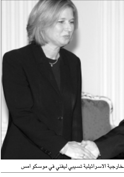
الرئيس الروسي فلاديمير بوتين لدى استقباله وزيرة الخارجية الاسرائيلية تسيبي ليفتي في موسكو امس

موسكو - اف ب: اعن الرئيس الروسي فلاديمير بوتين للرئيس الفلسطيني محمود عباس في اتصال هاتفي امس الاثنين ان موسكو ستبذل كل ما في وسعها للمساهمة في تطبيع الوضع في الأراضي الفلسطينية، على ما اعلمه المكتب الاعلامي في الكرملين لوكالة فرانس برس. وأوضح المكتب الاعلامي في بيان ان فلاديمير بوتين اشار الى عزم روسيا على الاستمرار في اتخاذ اجراءات والقيام بكل ما في وسعها للمساهمة في تطبيع الوضع في الأراضي الفلسطينية بأسرع ما يمكن». وجرى الاتصال الهاتفي بمبادرة فلسطينية بعد لقاء بين وزير الخارجية الاسرائيلية تسيبي ليفتي والرئيس الروسي في موسكو. ولتقت ليفتي قبل ذلك ايضا نظيرها الروسي سيرغي لافروف.