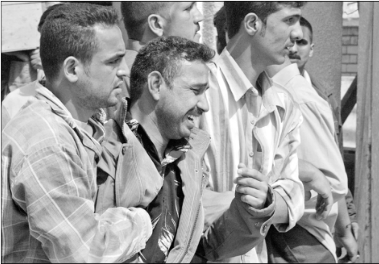
عراقي يبكي قريبا له قتل بانفجار عبوة ناسفة في مدينة بعقوبة امس

وبنفس السياق يقول وايتلي ان بغداد كانت تعيش حالة من الفوضى، فيما تفاقمت أزمة الخدمات الأساسية، ويعتقد وايتلي، الذي عمل بشكل مقرب مع الجنرال ديفيد ساكرينان ان السياسة الخارجية الأمريكية القائمة على الامم ان بديل فقير عن بناء الدول في مرحلة ما بعد الحرب، حيث قُتل ان المرحلة التي تلت الغزو لم يتم