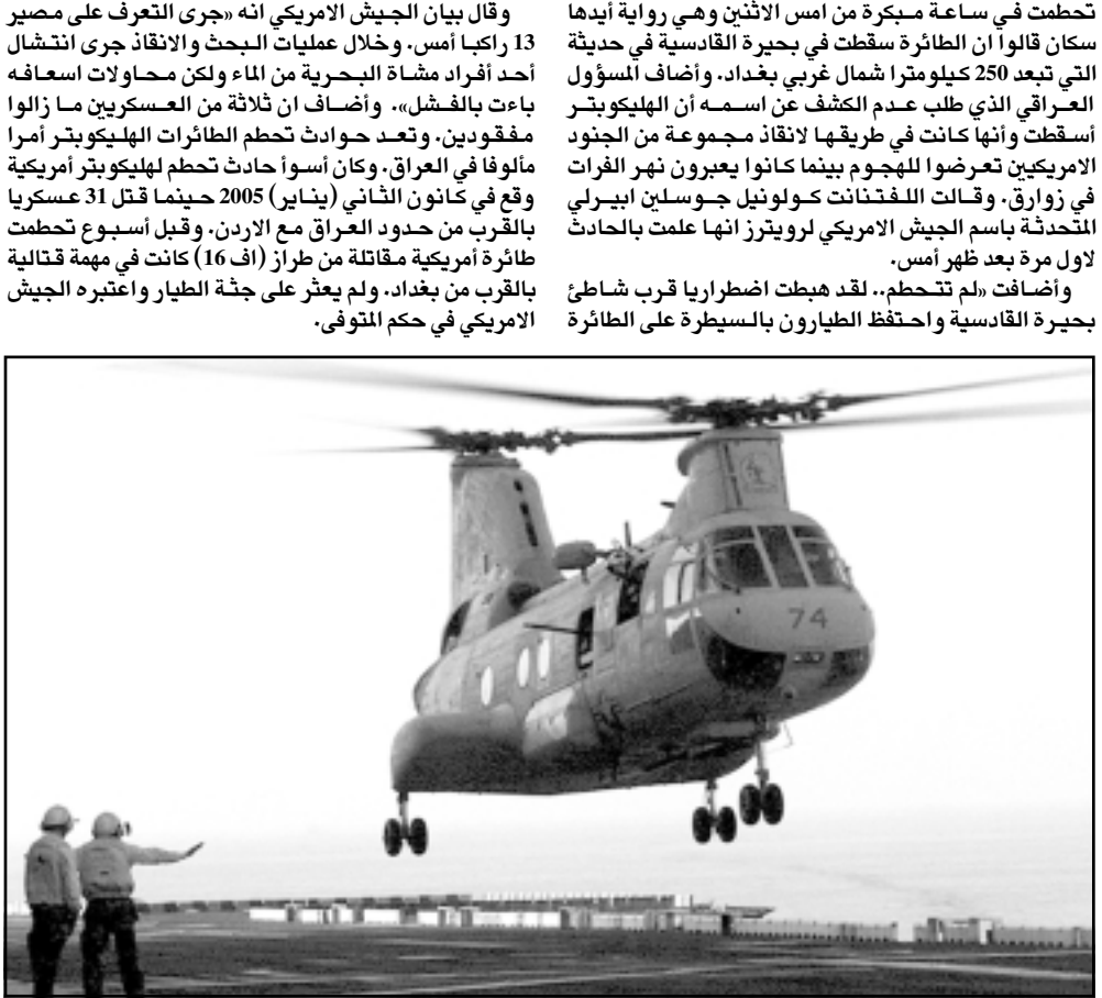
طائرة هليكوبتر من طراز (سي. اتش. 46 سي نايت) تشبه الطائرة التي سقطت في الانبار امس

قالت بيان الجيش الامريكي انه جرى التعرف على مصير 13 ركاباً امس، وخلال عمليات البحث والانقاذ جرى انتشال أحد أفراد مشاة البحرية من الماء ولكن محاولات اسعافه باءت بالفشل». وأضاف ان ثلاثة من العسكريين ما زالوا مفقودين. وتعد حوادث تحطم الطائرات الهليكوبتر أمراً مألوفاً في العراق، وكان أسوأ حادث تحطم لهليكوبتر امريكية وقع في كانون الثاني (يناير) 2005 حينما قتل 31 عسكرياً بالقرب من حدود العراق مع الاردن. وقبل اسبوع تحطمت طائرة امريكية مقاتلة من طراز (اف 16) كانت في مهمة قتالية بالقرب من بغداد، ولم يعثر على جثة الطيار واعتبره الجيش امريكي في حكم المتوفى.