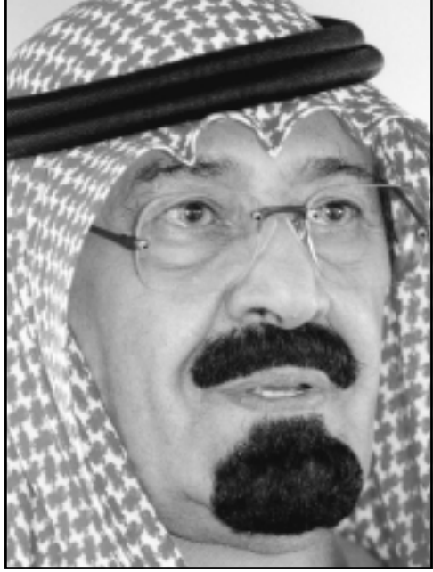
الملك عبدالله بن عبدالعزيز