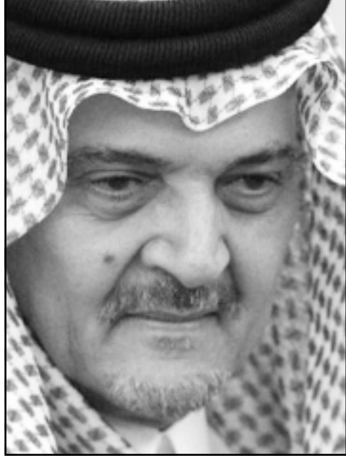
الامير سعود الفيصل بن عبدالعزيز