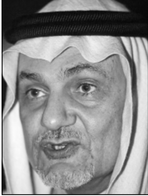
الامير تركي الفيصل بن عبدالعزيز