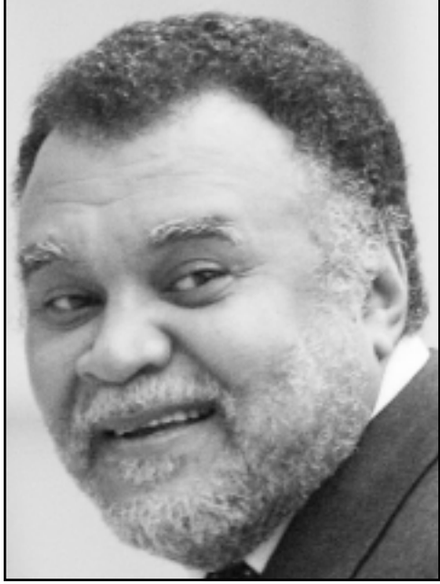
الامير بندر بن سلطان بن عبدالعزيز