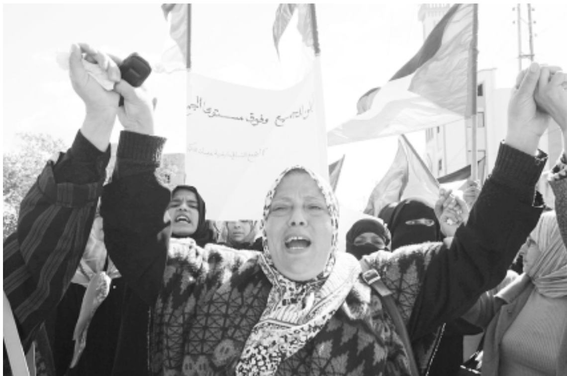
فلسطينيات يتظاهرن في غزة امس احتجاجا على صراع حماس وفتح