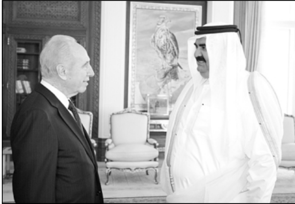
امير قطر الشيخ حمد بن خليفة آل ثاني لدى استقباله شيمعون بيريز في الدوحة امس الاول

تل ابيب- يوبي أي: رفض أمير قطر في بيان صحفي حمد بن خليفة آل ثاني طلبا تقدم به النائب الأول لرئيس الوزراء الإسرائيلي شيمعون بيريز برفع مستوى العلاقات بين قطر وإسرائيل، ورفض مستوى العلاقات. وأشارت الصحيفة الى أن بيريز لم يتم استقباله من قبل أي شخصية رسمية قطرية، لكن مع ذلك تم التعامل معه على أنه «شخصية هامة جداً»، وكان بيريز وصل الى قطر امس واجرى محادثات مع أمير قطر تناولت القضايا المتعلقة بالسرقة الأوسط. وذكر الصراخ الإسرائيلي الفلسطيني والبرنامج النووي الإيراني.