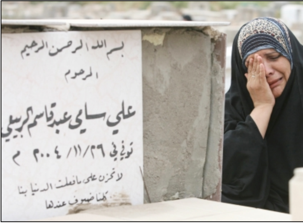
سيدة عراقية تبكي فوق قبر قريب لها في البصرة امس

واوضح كايسي خلال مؤتمر صحافي في بغداد «ان القوى الامنية العراقية ستكون قادرة على تولي الامن، وافاد