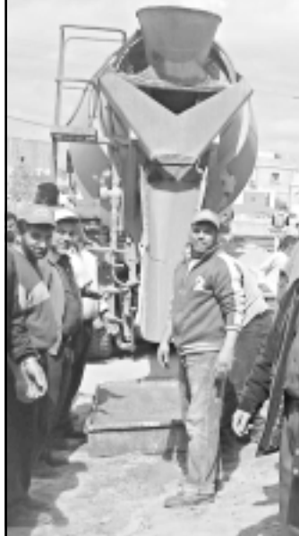
الشيخ رائد صلاح (يمين) يزور مشروع العمل التطوعي في النقب

جاء في كلمته ايضا «يراد للنقب ان يسيلق عن هويته، وكذلك هدم البيوت وسرقة الاراضي وورش الزروع والاتي اوكلت هذه المهمة للحاظر على جائزة نوبل للسلام»، في اشارة الى النائب من حزب كديما ورئيس الوزراء الاسرائيلي الاسبق شمعون بيرس، وأضاف الشيخ خطيب «اخذنا على نفسنا ان نتقن الشعارات وانما نتقن العمل والطاء والبذل لان هذا الزمن ليس زمن البكاء والعيول على ايواب الشام، وانما زمن العمل والطاء، وشكر الشيخ كمال خطيب في ختام كلمته جميع مسؤولي الحركة الاسلامية في البلدت والقرى والندن العربية و في الداخل كونهم عملوا على انجاح هذا المشروع، وشكر كذلك اللجان التي تشكلت لاجراج الشركات الى حيز التنفيذ. وأكدت الكلمة الختامية للشيخ رائد صلاح رئيس الحركة الاسلامية، التي قال في كلمته «هو هنا نقول للذين باتوا