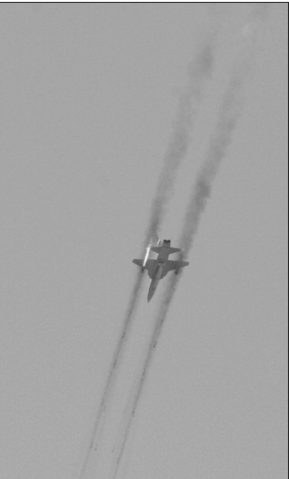
طائرة مقاتلة تحمل اسم «رعد» مجهزة بأحدث أنظمة الرادار، قالت ايران انها طوّرت نسخا منها الى مستوى المقاتلة الأمريكية «اف 18»

■ لندن - اف ب: اظهر استطلاع للرأي نشرت صحيفة «التايمز» البريطانية امس الاربعة ان غالبية البريطانيين يعتبرون ان السياسة الخارجية الحالية التي تتبعها الحكومة تزيد من مخاطر الهجمات الارهابية في البلاد. وابدى غالبية الأشخاص الذين استطلعت آراؤهم بتأييدهم لان تنأى الحكومة البريطانية بنفسها عن مواقف البيت الابيض بهدف خفض مخاطر الهجمات. وكان رئيس الوزراء البريطاني توني بلير واجه انتقادات شديدة الشهر الماضي حين ايد مواقف الرئيس الأمريكي جورج بوش وامتنع عن الدعوة الى وقف اطلاق نار بين حزب الله الشيعي اللبناني واسرائيل. واعتبر 73 في المئة من الأشخاص الذين شملهم الاستطلاع ان «السياسة الخارجية للحكومة البريطانية زادت من مخاطر الهجمات الارهابية في بريطانيا». ووافق 62 في المئة من البريطانيين على القول ان «على الحكومة ان تغير سياستها الخارجية وخصوصا ان تنأى بنفسها عن امريكا من اجل خفض مخاطر هجمات ارهابية في بريطانيا». وتنتج هذا الاستطلاع الاخير مشابهة لنتائج استطلاع اجراه معهد «اي سي ام» ونشرتته صحيفة الغارديان الشهر الماضي وأشار الى ان 72 في المئة من الأشخاص يعتقدون ان السياسة الخارجية البريطانية تزيد من مخاطر الهجمات الارهابية في البلاد.