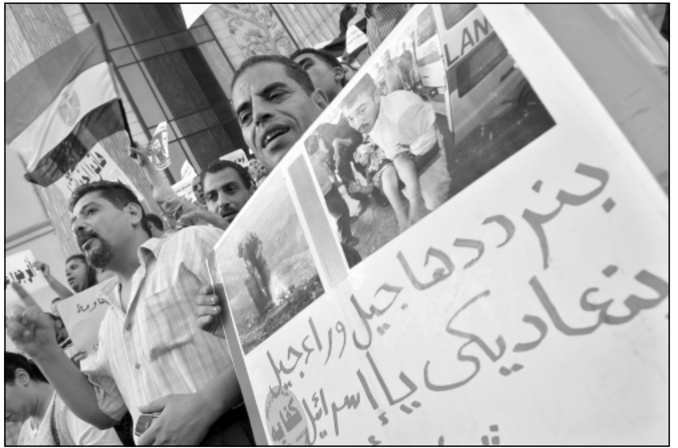
مصريون يتظاهرون احتجاجاً على العدوان الإسرائيلي