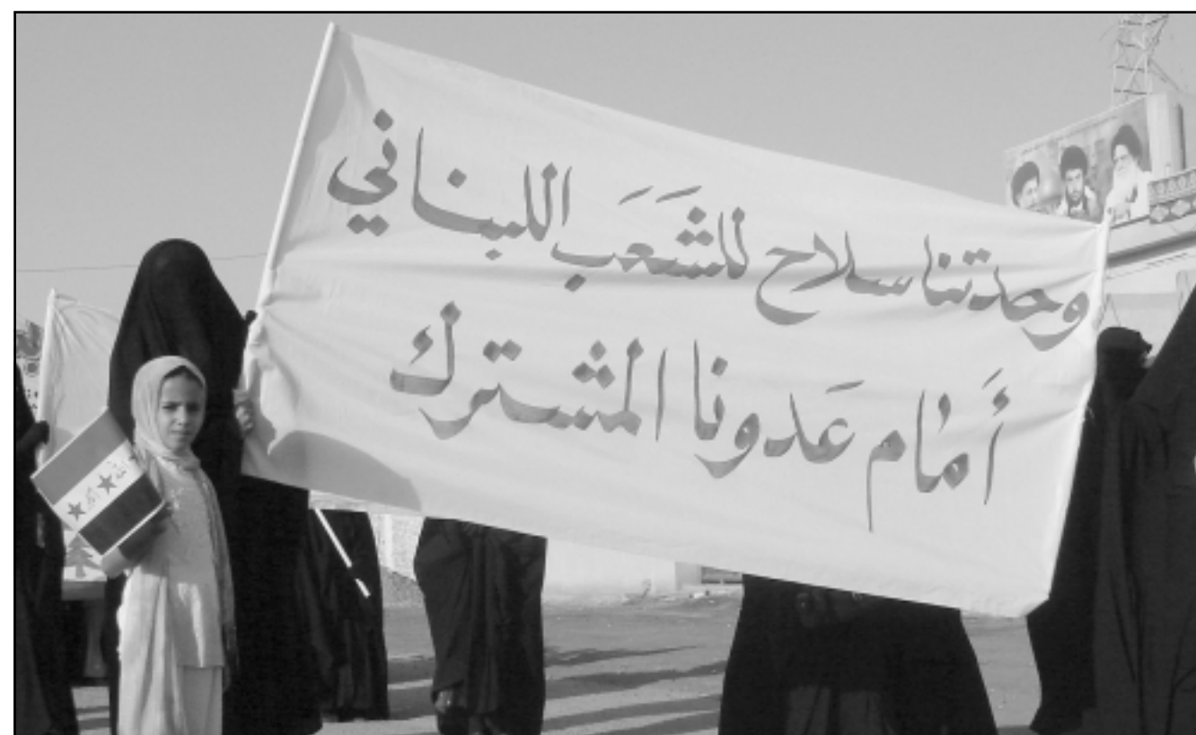
سيدات عراقيات في مسيرة تضامن مع الشعب اللبناني

ان طلبة العراق يعلنون تضامنهم مع الشعب اللبناني الشقيق ويؤيدون مقاومته المشروعة في الدفاع عن كرامته وكرامة الاممة العربية والاسلامية وكرامة الانسان ايما كان وقته في مقاومة المحتل والغاصبي كما ندب و بشدة وتواطؤ الحكومات العربية ومنظمة المؤتمر الاسلامي والجمعية العامة للامم المتحدة مع الصهاينة المنظرين الغاصبين لارض العربية فلسطين والجولان والعراق وصمة عار في جبيننا ايتها الانسانية وصمة عار في جبيننا ايتها الانسانية ان تسكتي على اهانة واستباحة الاطفال والنساء والشيوخ، الحزني لاوريا وامريكا ان لم تصحبا من غيبيو يتهما العار على روسيا والصين وفرنسا ان تترك هؤلاء القتلعة يعيشون في الارض الفساد اما ان للانسانية ان تنبذ الدماء اما ان