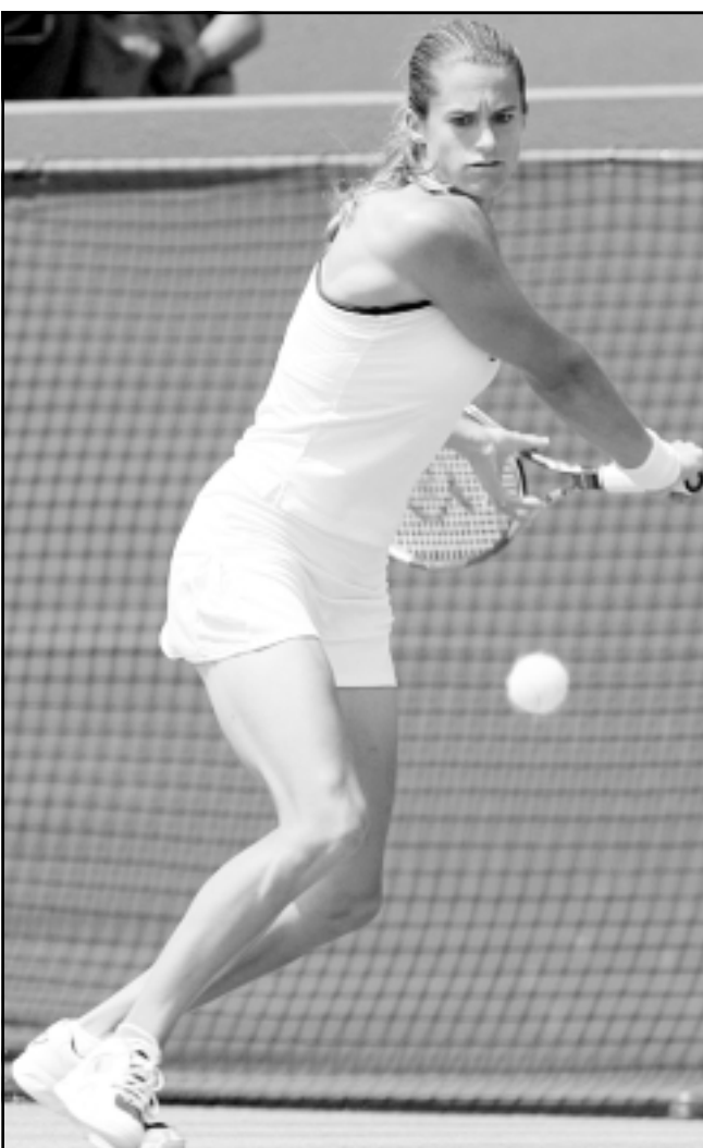
الفرنسية اميلي موريسمو

والذين للمرة الثانية ستقام الى جانب كرة القدم، بطولات في الكرة الطائرة وكرة السلة وكرة اليد، كما حصل في النسخة الماضية في قطر.