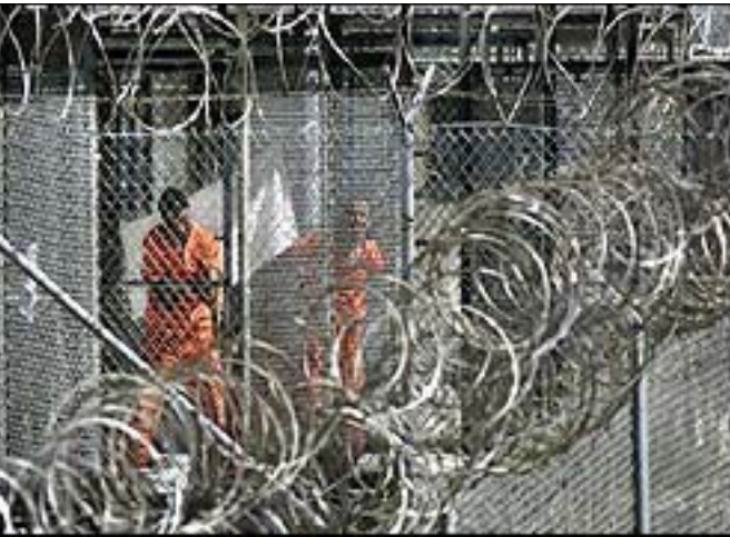
شافعي على متن العبارة هاملتون في طريقها الى المعسكر.