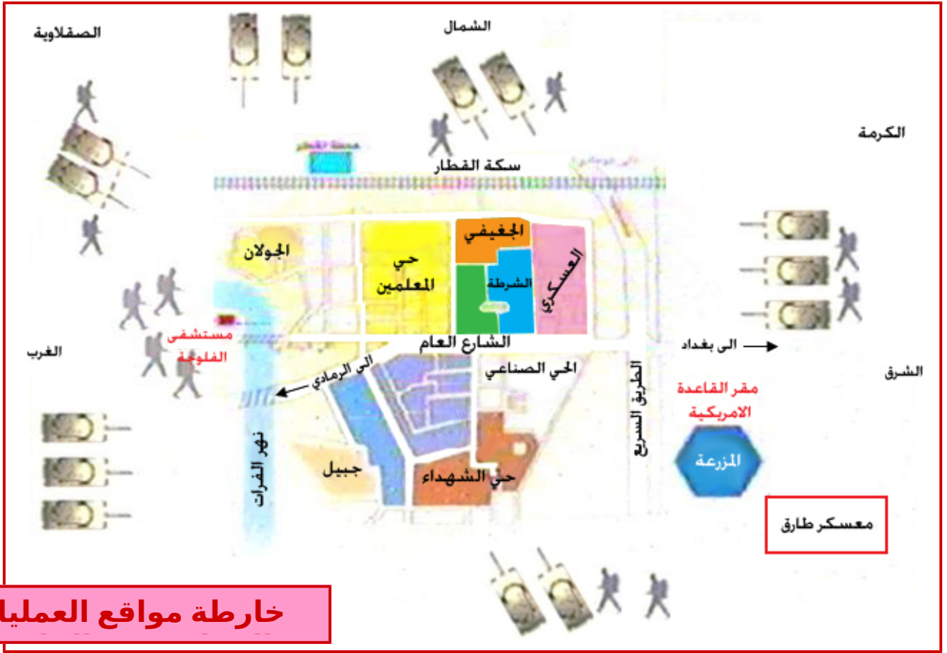
خارطة مواقع العمليات