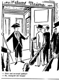
— Sette anni avverso politici? — No, magistrato di Cerruti!