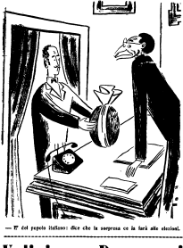
— Il del popolo italiano: che che la sorpresa ce la farà alle elezioni.