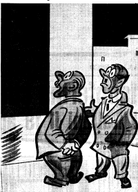
— Cosa leggi? — È il manifesto delle promesse che la D.C. fece nel 1945.