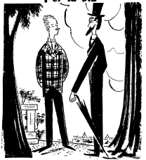
— Ho fatto di tutto e dico... — No, scusi?