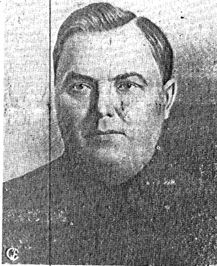
GEORGI M. MALENKOV, Presidente del Consejo de Ministros de la U.R.S.S.

En los cuatro meses transcurridos desde el fallecimiento de