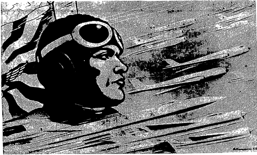
Плакат работы художника А. Кокореккина.