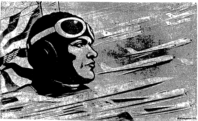
Плакат работы художника А. Кокоркина.