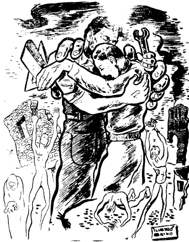
La unión de obreros y estudiantes.— Por Mervin.