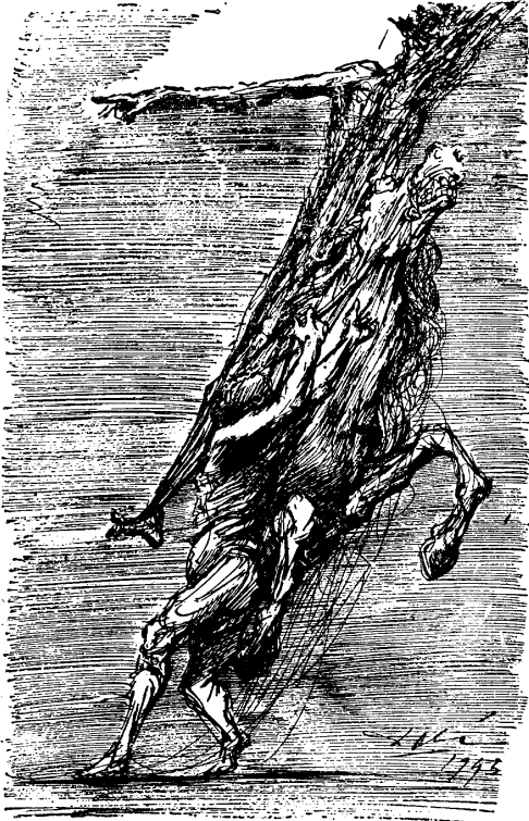
Don Quijote, Sancho Panza y Rocinante.—Dali

"El terreno está abonado, pues, para que los trabajadores sindicalizados superen la etapa en que han madurado su instinto de clase, extraordinario por cierto, y adquieran una verdadera conciencia de clase. La instrucción de la clase obrera acerca de su historia, sus luchas y el papel que está llamada a desempeñar, se convierte así en una de las fundamentales tareas de las directivas sindicales".