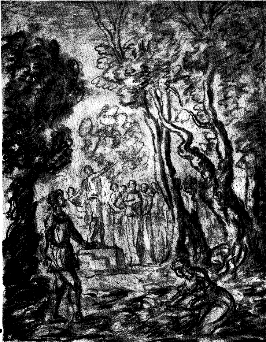
Ilustración de Chirico, para el Canto X.—GALERIAS DE ARTE