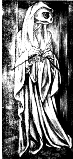
"LA PARCA". Grau Araujo. Galerías de Arte.

La sede de la organización ha quedado en el propio centro de Bogotá, —Avenida Jiménez de Quesada, 5-61—, en cuya puerta resulta, en verdad, una leyenda sencilla: "Galerías de Arte". En el interior dos salones de exposiciones sencillamente decorados, servirán para realizar conjuntamente una exposición personal y una colectiva. Por primera vez en Bogotá se expone observando las normas técnicas de exposiciones. Los ángulos se descomponen en todo el salón, permitiendo una mejor visión de los cuadros. En uno de los salones habrán de realizarse, periódicamente, cursos sobre arte. Al inaugurarse las "Galerías de Arte" se exhibirán cuadros de colombianos y europeos. Firmas de colombianos suficientemente acreditadas por sus realizaciones, y firmas de europeos, incorporadas definitivamente a la historia