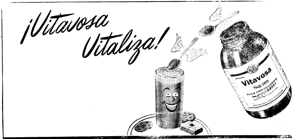
Sintonice "Alborada Musical Squibb".—Diariamente, Voz de la Victor, 7.30 de la mañana. "Baile Con Nosotros", diariamente, Radio Mundial, 11 de la noche.

El Decreto 1273 de 1948 autoriza al gobierno nacional para contratar con el Export and Import Bank, y con el Banco de Reconstrucción y fomento empréstitos externos hasta por la cuantía de US$ 60.000.000 destinados a invertirse en las obras de recons-