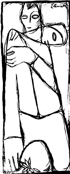
Ilustración de Eduardo Ramírez Villamizar.