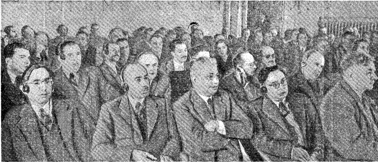
На заседании секции по вопросам международного экономического сотрудничества для разрешения социальных проблем.

Г-н Прокш предлагает создать постоянное бюро для того, чтобы страны, которые имеют свои пожелания, обращались к этому бюро и получали от него консультации.